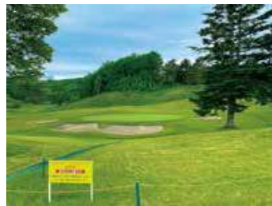
▲ 道内屈指の規模のアプローチ練習場は旧南コース9番ホールを改修して2022年に新設されました。4つのバンカーが設置された練習場は本番さながらのクオリティ。(ご利用の際はスタート室にて番号札が必要になります。)