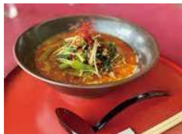
▶ 芙蓉式担々麺&麻婆豆腐 / 有名ホテルの中華レストランの料理長を務めたシェフが提供する中華料理は、ゴルフ場の域を超えた至極のゴルフめし。