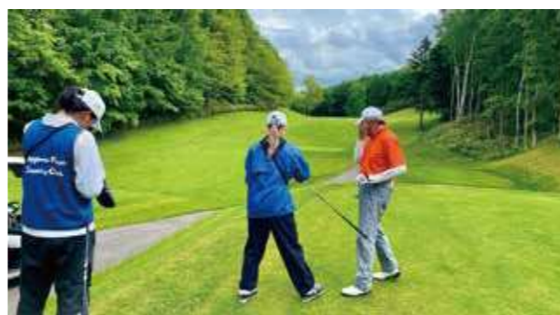
◀▶ 先輩キャディに付いてキャディ研修中。1回の座学を受講したあと、先輩キャディに付いて実習研修、そして最終的な試験に合格をするとキャディとして独り立ちできる。言葉も違う異国で早ければ3か月で合格する留学生もいるというのは驚き！また、キャディ業務はお客様と会話の機会が多く日本語の語学勉強にもうってつけ。在籍大学へ定期的にレポートを提出することで大学側からも安心して生徒を預けることができると喜ばれている。留学生キャディは中国、マレーシア、ベトナム、ミャンマーからが多い。