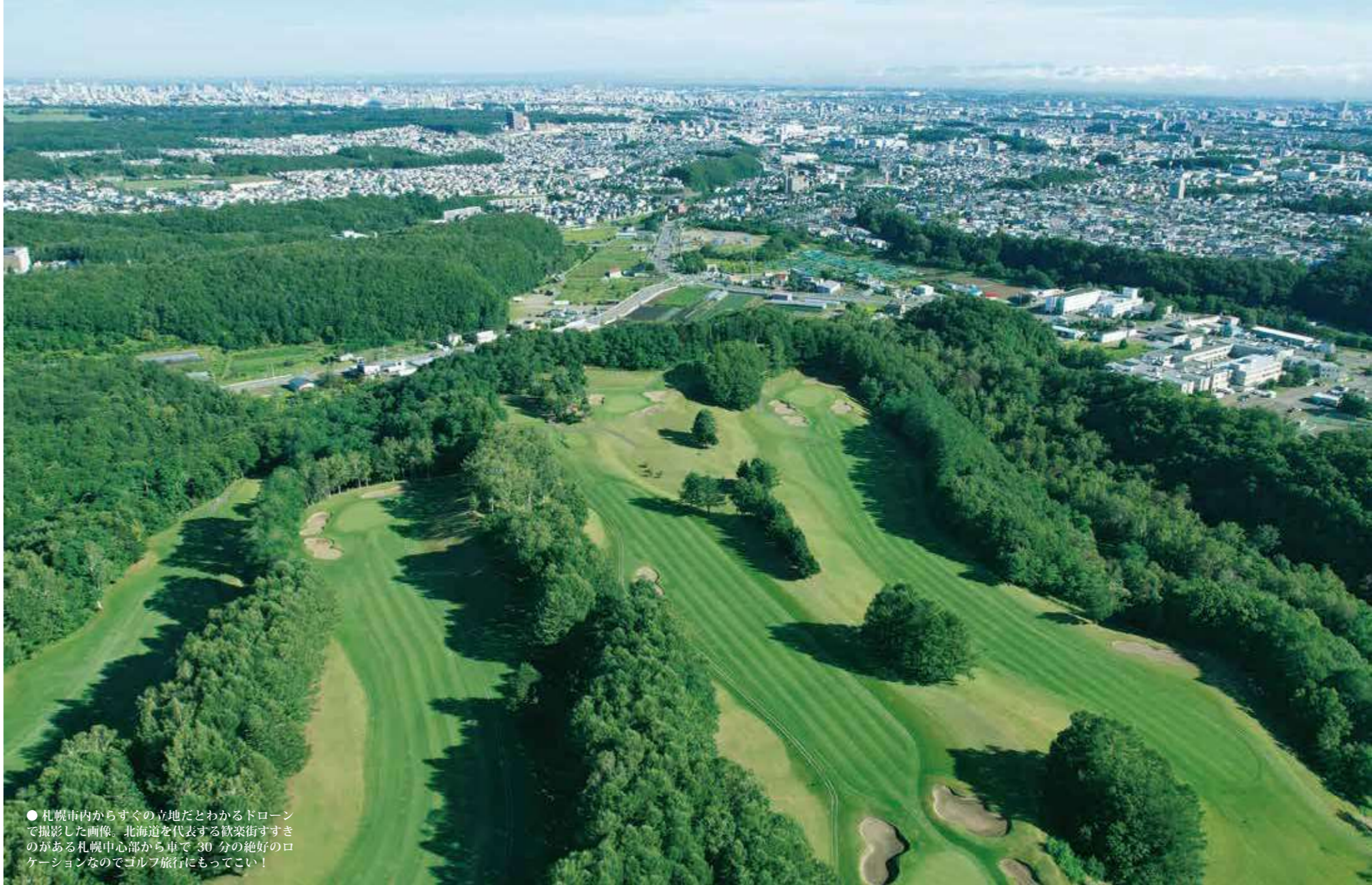
● 札幌市内からすぐの立地だとわかるドローンで撮影した画像。北海道を代表する歓楽街すすきのがある札幌中心部から車で30分の絶好のロケーションなのでゴルフ旅行にもってこい！

Play & Photos & Text : Atsushi Konno / Play : Kensuke Soda