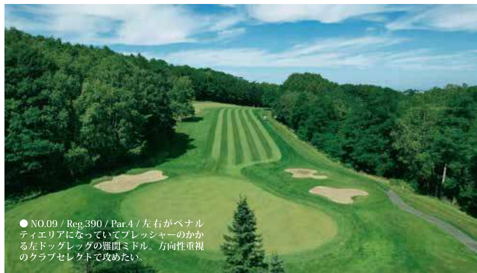
● NO.09 / Reg.390 / Par.4 / 左右がペナルティエリアになっていてプレッシャーのかかる左ドッグレッグの難関ミドル。方向性重視のクラブセレクトで攻めたい。